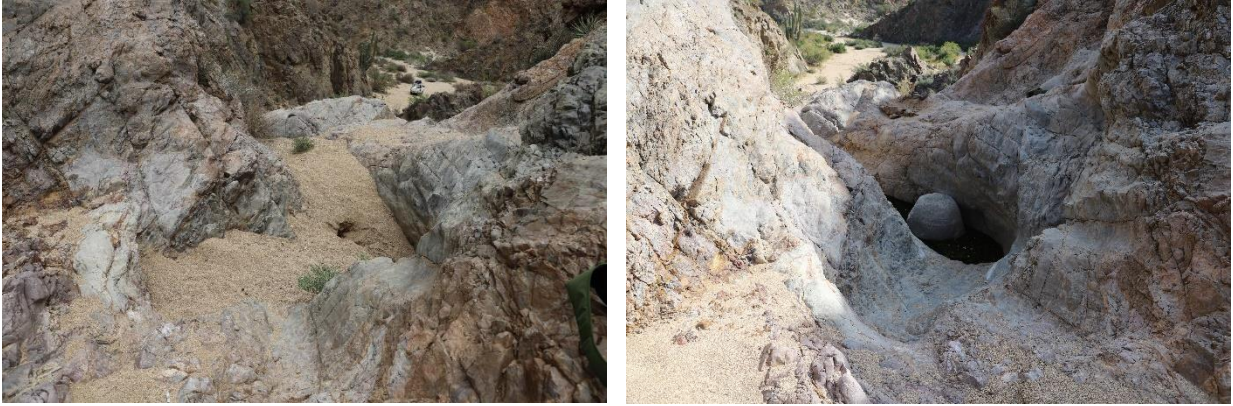
Figura 5. Tinaja de la Rinconada antes (izquierda) y después (derecha) de ser desazolvada.

En el espacio que se limpió en el Palmar del Desmayado se registró la presencia de especímenes de venado bura ( Odocoileus hemionus ), puma ( Puma concolor ), coyote ( Canis latrans ) y zorra gris ( Urocyon cinereoargenteus ; Figura 6).