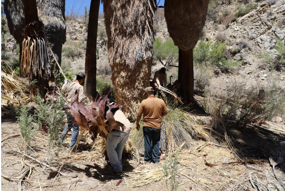
Figura 1. Brigada de Mejoramiento del Hábitat retirando los residuos de palma del lecho del arroyo del Palmar del Desmayado.