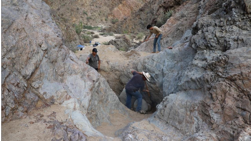
Figura 3. Brigada de Mejoramiento del Hábitat desazolviendo la Tinaja de la Rinconada.