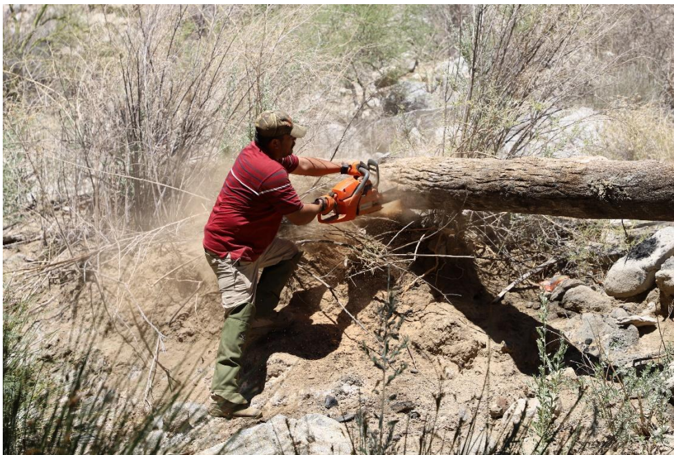
Figura 2. Miembro de la Brigada de Mejoramiento del Hábitat troceando un tronco de palma muerta para poder retirarlo del cauce del arroyo.