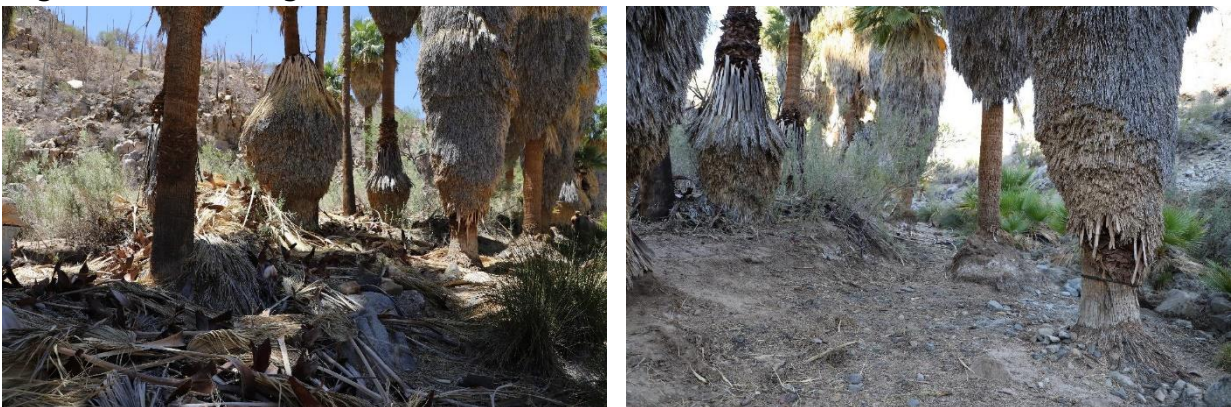
Figura 4. Porción del lecho del arroyo del Palmar del Desmayado antes (izquierda) y después de la jornada de limpieza (derecha).

Se abrió un espacio de 1,000 m 2 en el Palmar del Desmayado para que pueda ser usado por la fauna silvestre (Figura 4) y la Tinaja de la Rinconada recupero su capacidad para almacenar el agua de la lluvia (Figura 5).