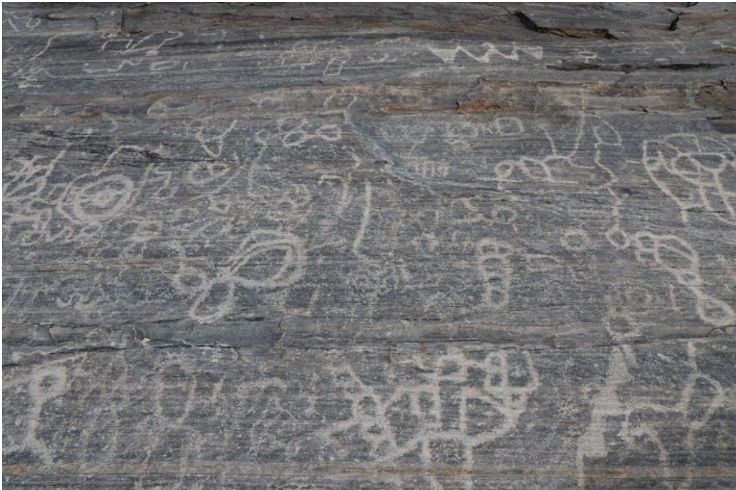
Figura 3. Petrograbados de Las Pintadas.