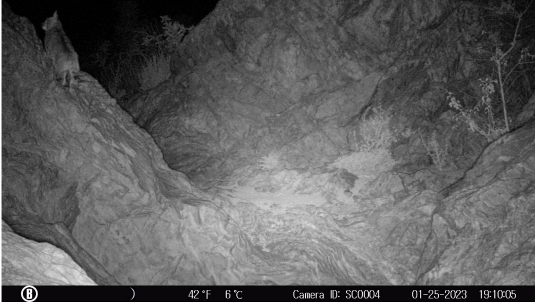
Figura 7. Lince registrado en la Tinaja de la Rinconada.