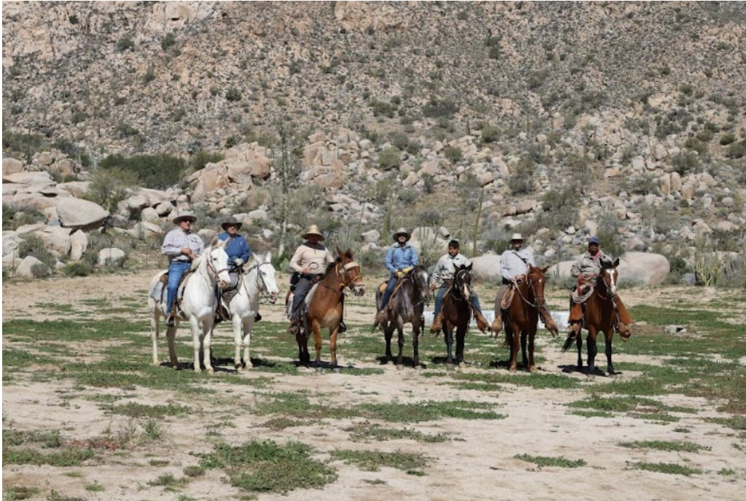
Figura 1. Comité del Santuario Cimarrón en compañía de pobladores locales.

En abril, el Comité del Santuario Cimarrón en compañía de algunos pobladores locales realizó una expedición al sitio de arte rupestre conocido como Las Pintadas (Figura 1). Este sitio es una pared de piedra laja en el que hay diversos Petrograbados (Figura 2; Figura 3). Se ubica en el lecho de un arroyo a una distancia de 13 km del Paraje del Palmar en dirección noreste (Figura 4). El objetivo de la expedición fue generar un registro de este sitio arqueológico para compartirlo con las instituciones pertinentes y en conjunto generar información que le aporte valor al Polígono Norte.