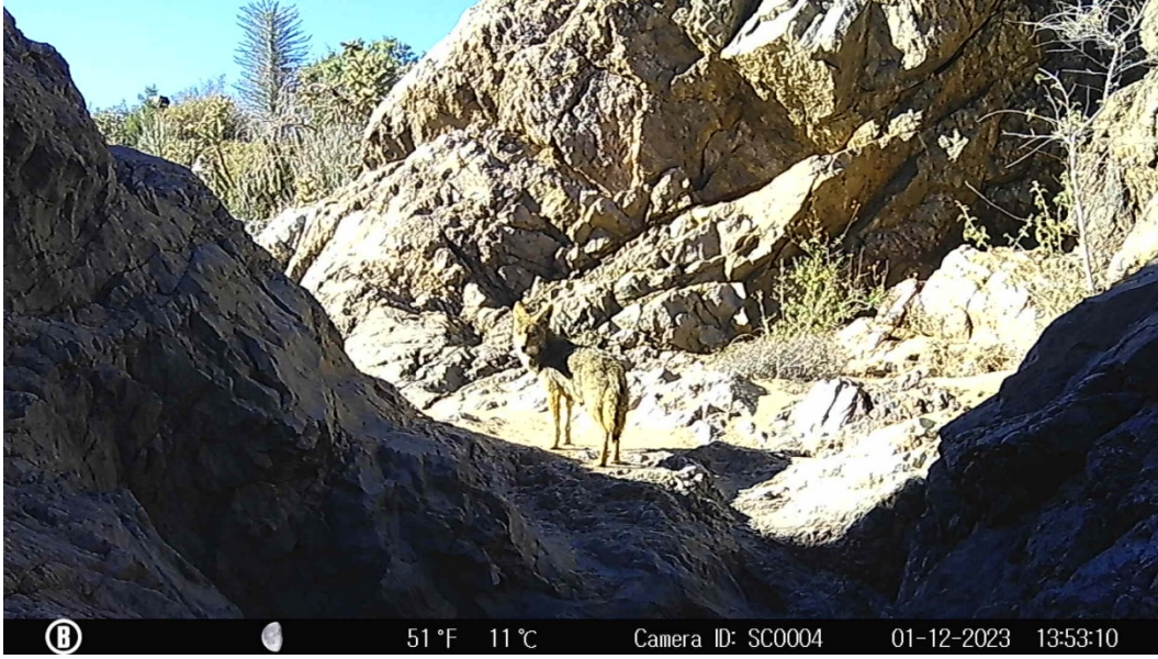
Figura 9. Coyote registrado en la Tinaja de la Rinconada.