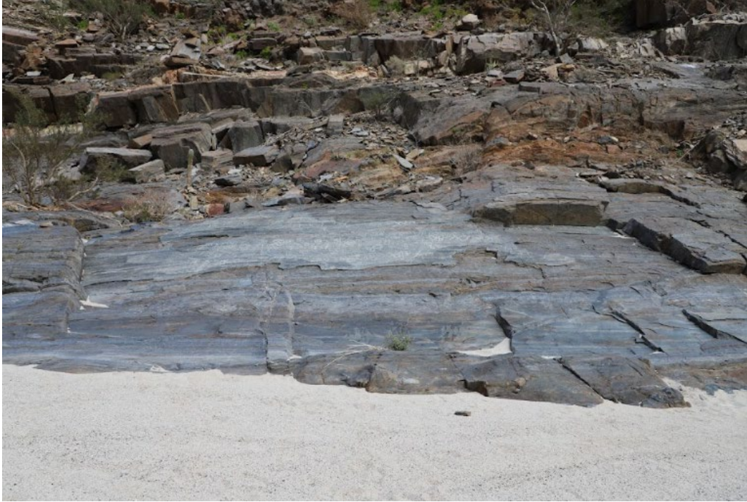
Figura 2. Sitio de arte rupestre Las Pintadas.