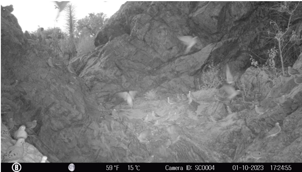
Figura 10. Congregación de huijotas en la Tinaja de la Rinconada.