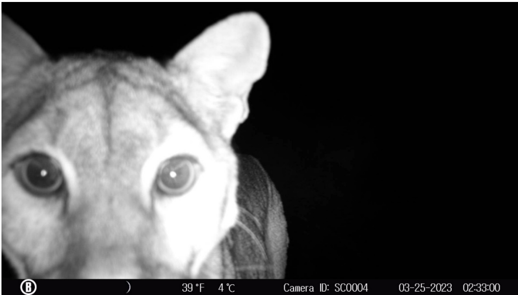
Figura 8. Puma registrado en la Tinaja de la Rinconada.