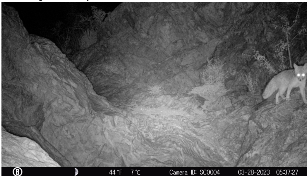
Figura 6. Zorra gris registrada en la Tinaja de la Rinconada.

La presencia de la fauna silvestre en la Tinaja de la Rinconada se atribuye a la rehabilitación que el personal de la Fundación UABC hizo en agosto de 2022 con la que la tinaja recuperó su capacidad de almacenar el agua de lluvia. Se llega a esta conclusión pues durante todo el primer semestre del 2023 la tinaja ha tenido agua, que probablemente ha captado de las esporádicas lluvias que suceden en el área, y esta condición ha atraído a los ejemplares silvestres que se registraron en las cámaras pues en los videos se observa como los animales llegan a tomar agua a la tinaja.