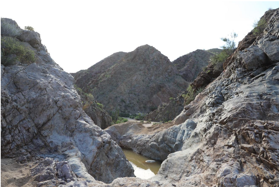
Figura 4. Tinaja de la Rinconada rehabilitada y completamente llena de agua.