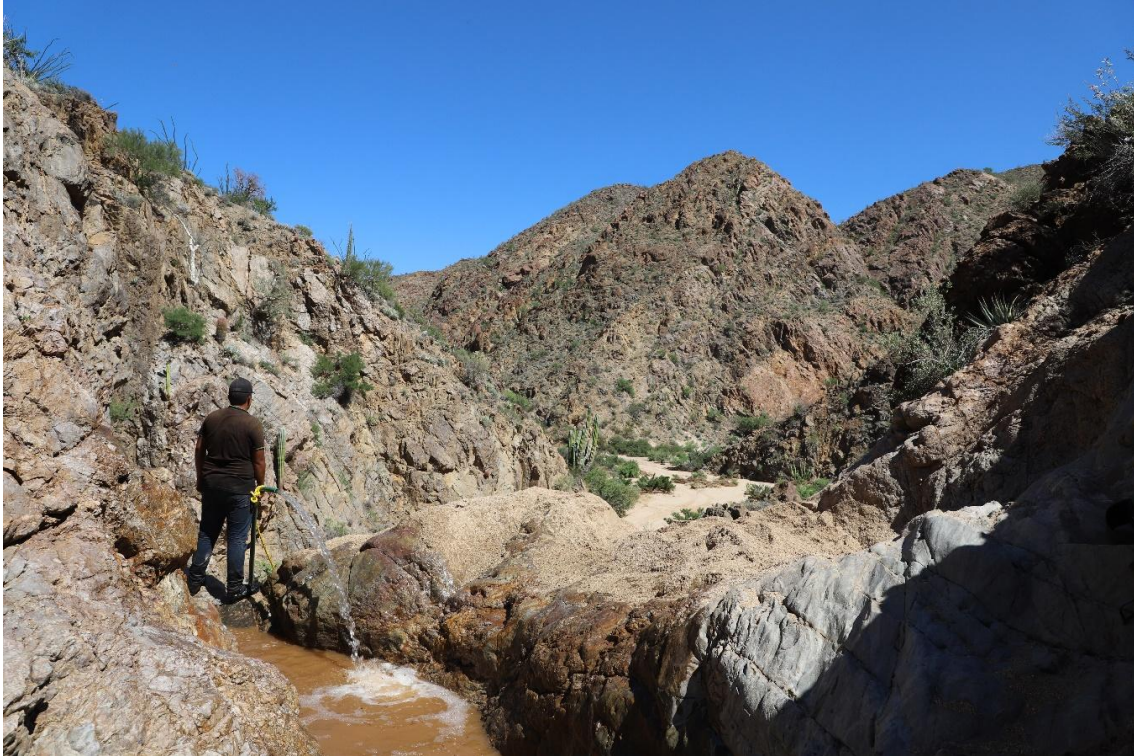
Figura 3. Abastecimiento de la Tinaja de la Rinconada.