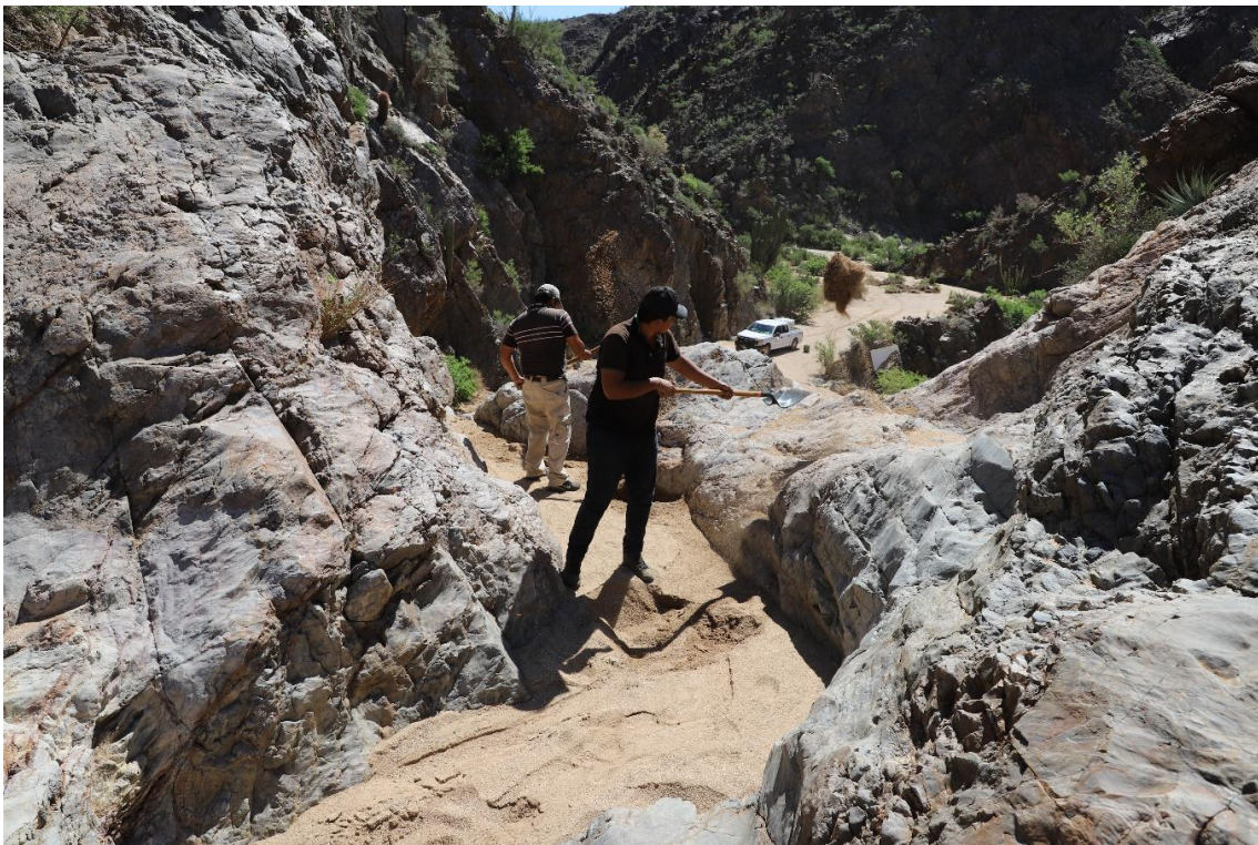
Figura 2. Desazolve de la Tinaja de la Rinconada.