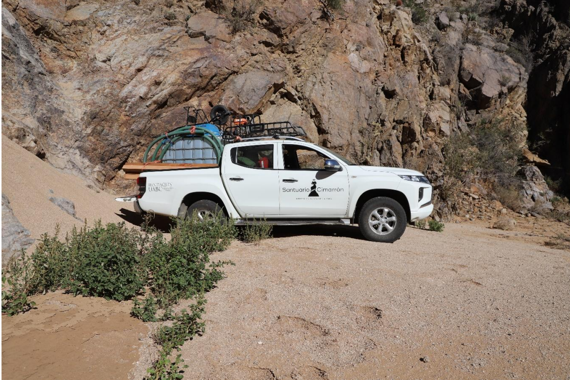
Figura 5. Vehículo de la Fundación UABC cargado con el equipo necesario para reabastecer la Tinaja de la Rinconada.