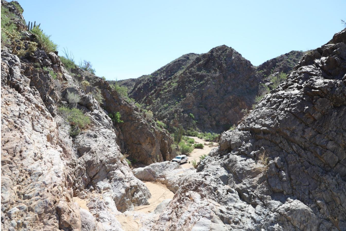
Figura 1. Tinaja de la Rinconada completamente azolvada con arena.